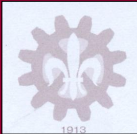
100 ème PROMOTION « ABBE VERHELST »