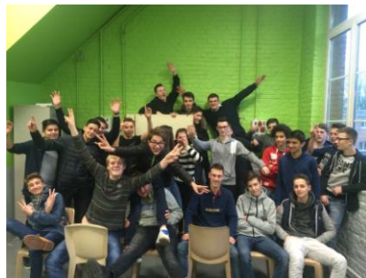
SOLARITEK, c'est NOUS !!