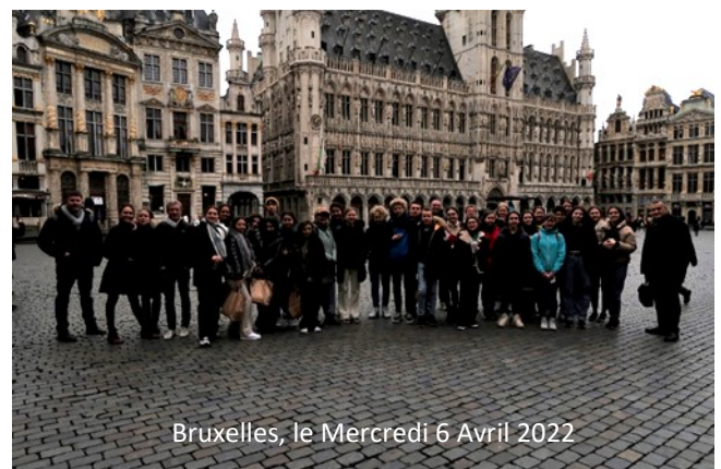
Bruxelles, le Mercredi 6 Avril 2022

En octobre, nous nous rendrons à Istanbul, à Amsterdam en janvier 2023 pour enfin terminer en mai 2023 à Barcelone.