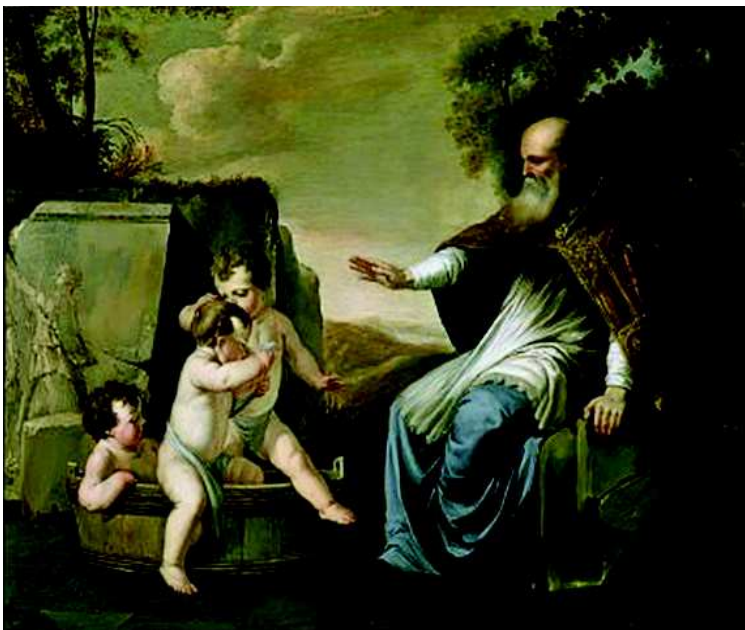
Saint-Nicolas ressuscitant trois enfants - Marguerite de La Hyre

« Ils étaient trois petits enfants qui s'en allaient glaner aux champs... » C'est la Saint-Nicolas ! Les habitants des contrées du nord de l'Europe et les Lorrains chérissent autant le saint patron des enfants que l'enfant de la crèche. Avec la Saint-Nicolas, on sent que Noël est proche !